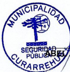
ABEL PAINEÑO BARRIGA ALCALDE Presidente Consejo Comunal de Seguridad Pública