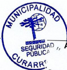
ABEL PAINEÑO BARRIGA ALCALDE Presidente Consejo Comunal de Seguridad Pública